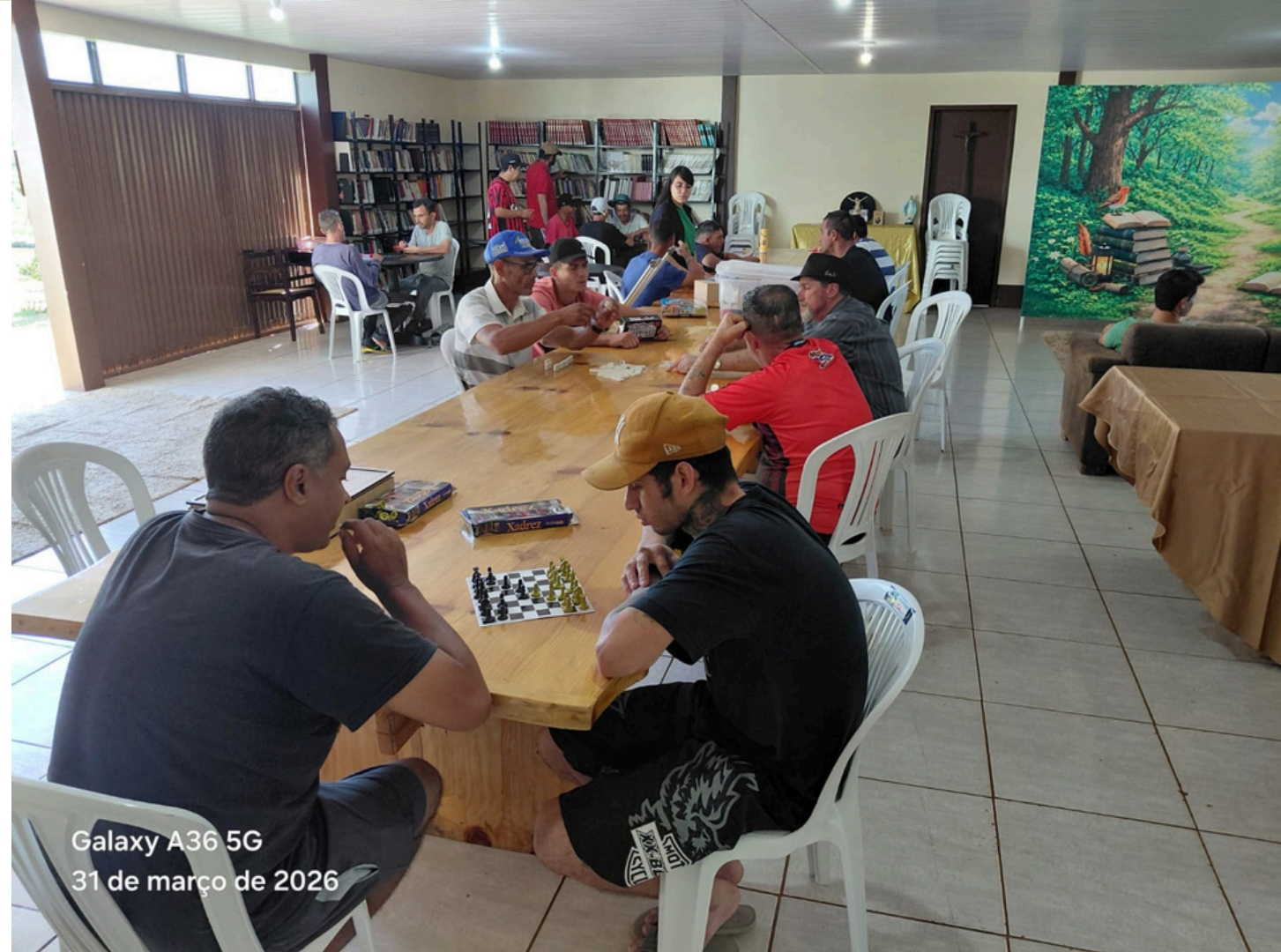
Galaxy A36 5G 31 de março de 2026