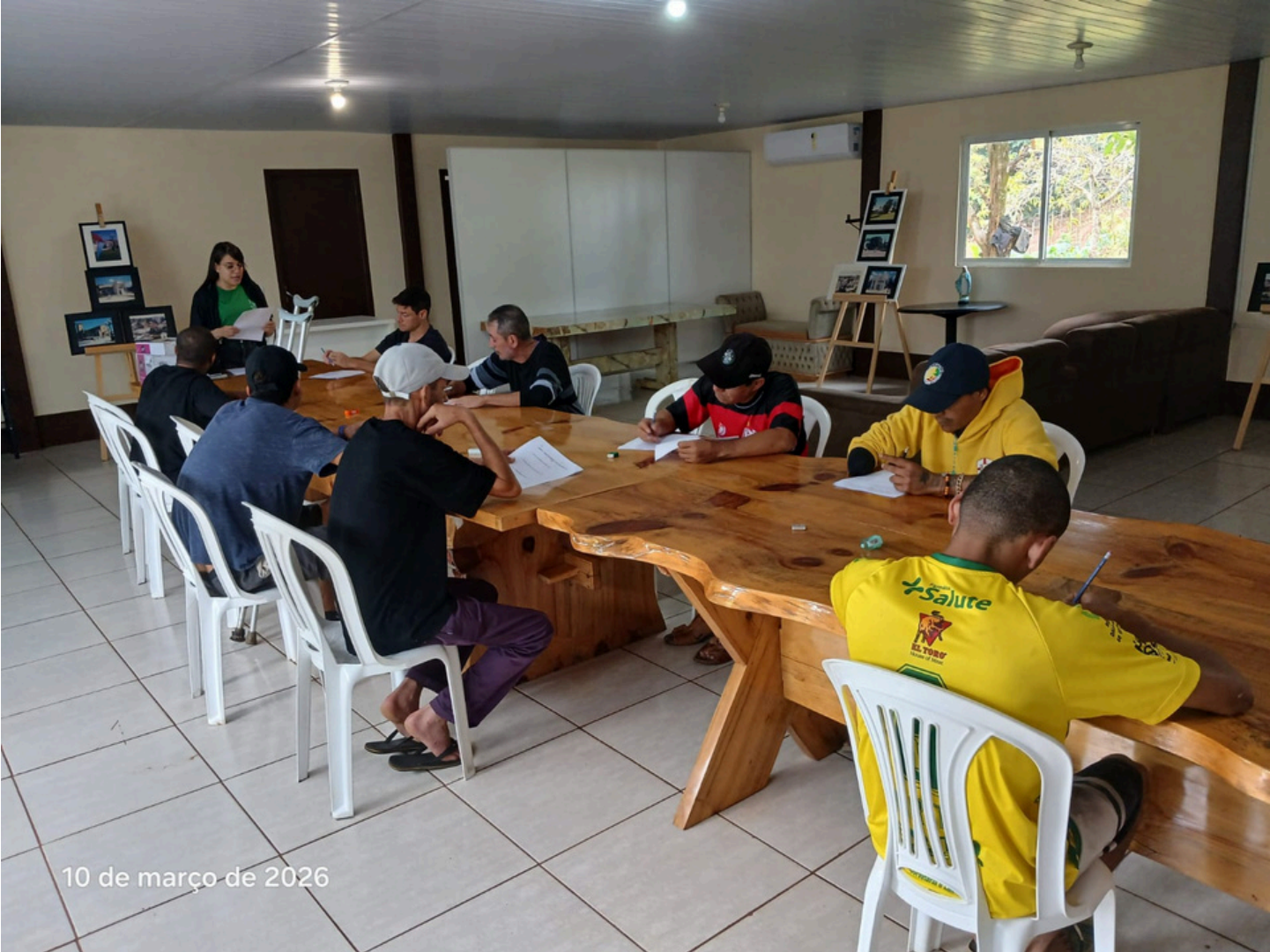
10 de março de 2026