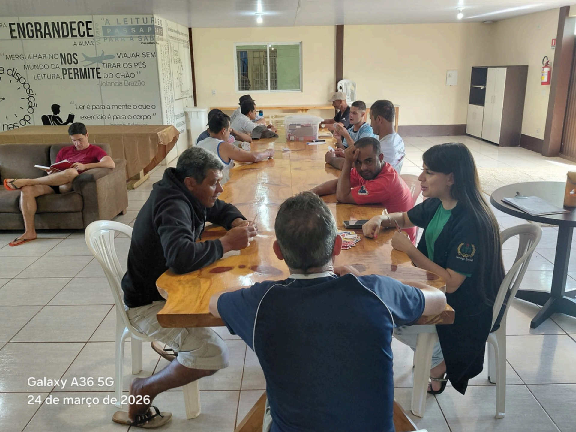
Galaxy A36 5G 24 de março de 2026