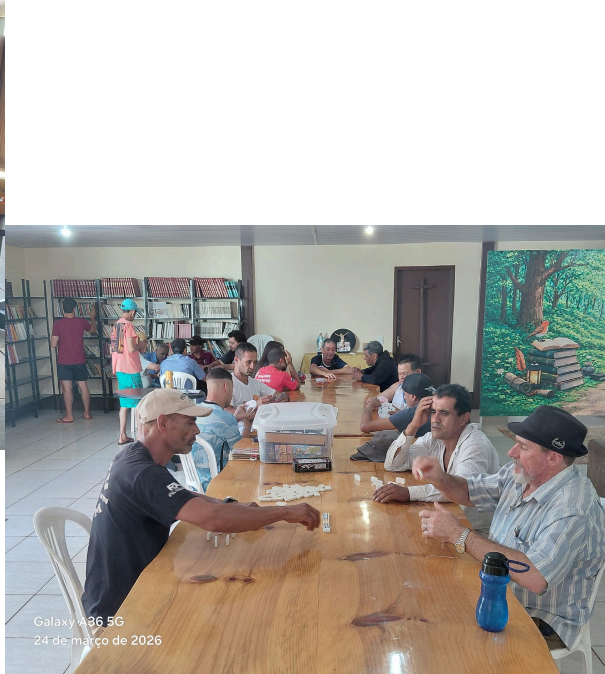
Galaxy A36 5G 24 de março de 2026