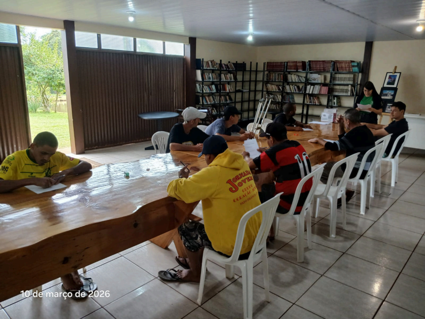
10 de março de 2026