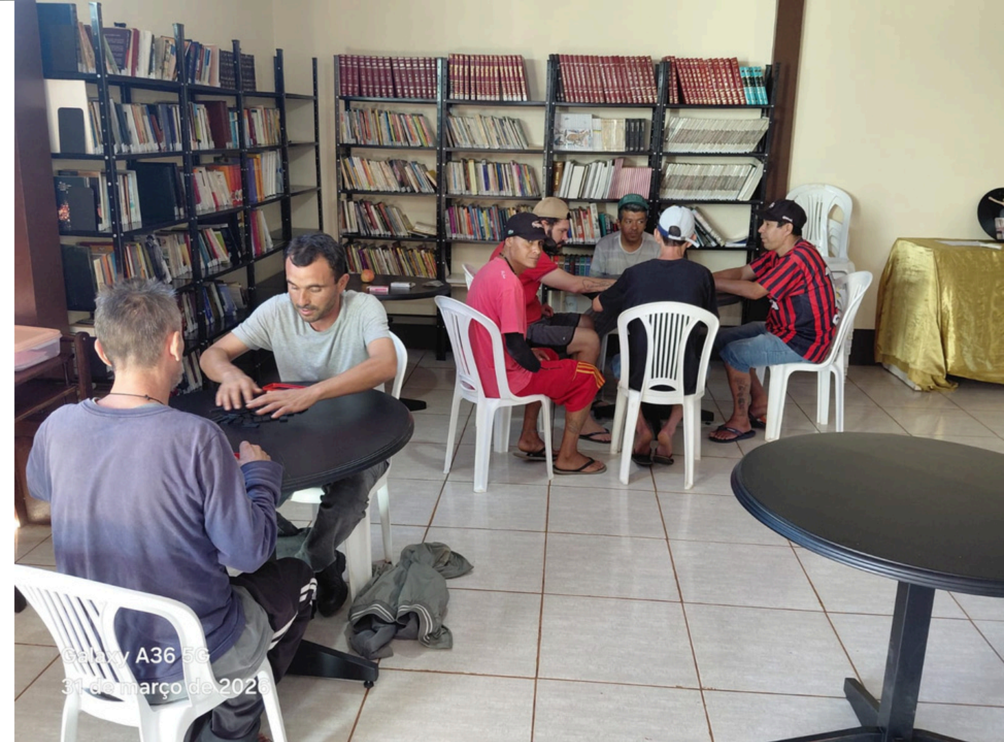
Galaxy A36 5G 31 de março de 2026