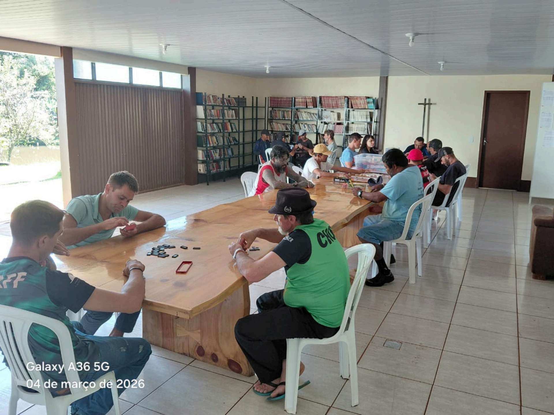
Galaxy A36 5G 04 de março de 2026