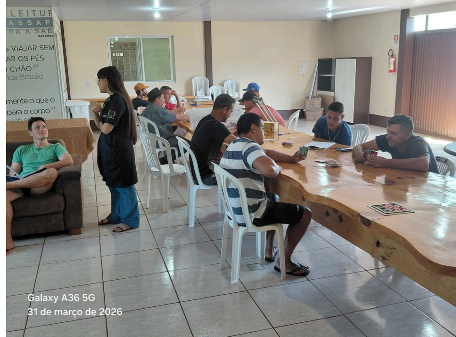
Galaxy A36 5G 31 de março de 2026