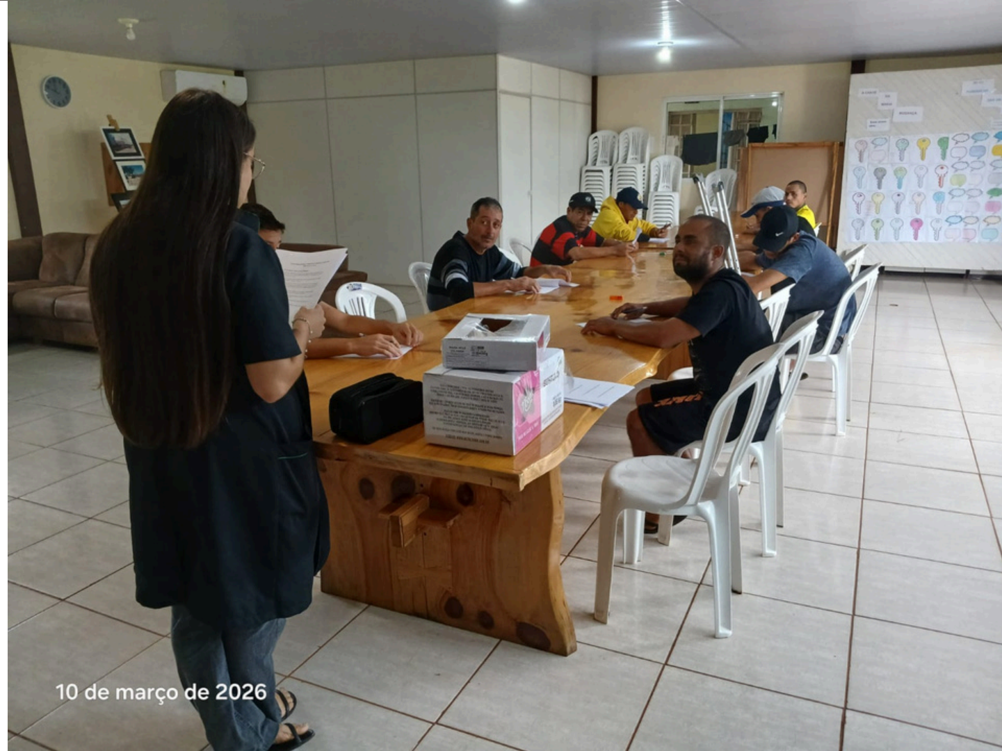
10 de março de 2026